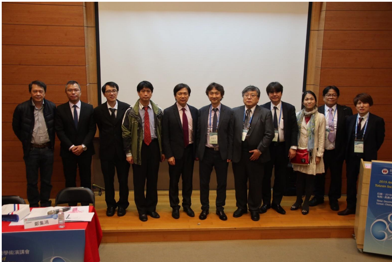
台灣基層透析協會/台灣血管外科學會/日本外賓 大合照